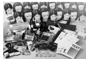
一部の教材です(イメージ)