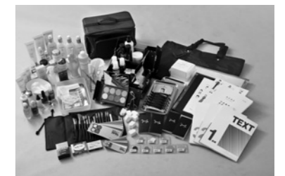
一部の教材です(イメージ)